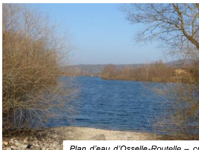
Plan d'eau d'Osselle-Routelle